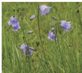
Grasklokje ( Campanula rotundifolia )