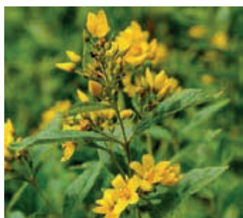
Grote wederik ( Lysimachia vulgaris )