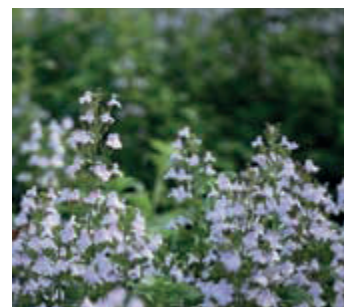
Bergsteentijm ( Calamintha nepeta )