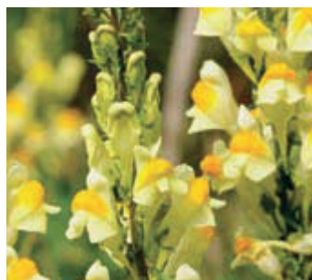
Vlasbekje ( Linaria vulgaris )