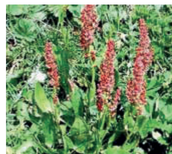
Boerenwormkruid ( Tanacetum vulgare )