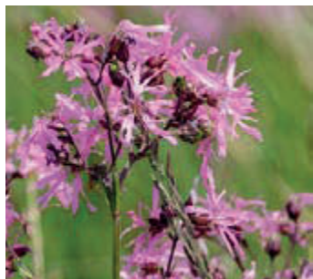
Echte koekoeksbloem ( Lychnis flos cuculi )