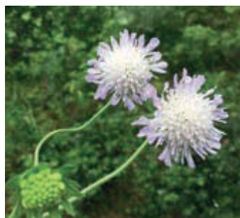
Beemdkroon ( Knautia arvensis )