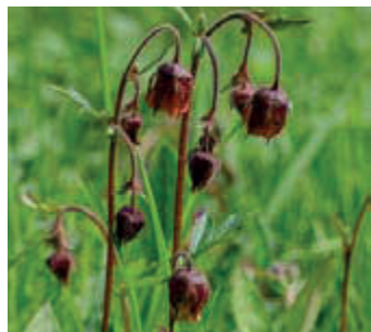
Knikkend nagelkruid ( Geum rivale )