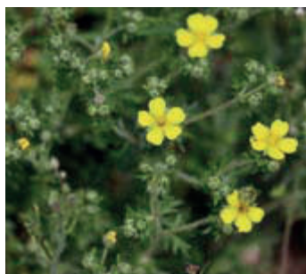
Viltganzerik ( Potentilla argentea )