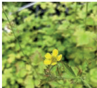
Geel nagelkruid ( Geum urbanum )