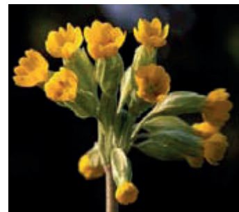
Echte sleutelbloem ( Primula veris )