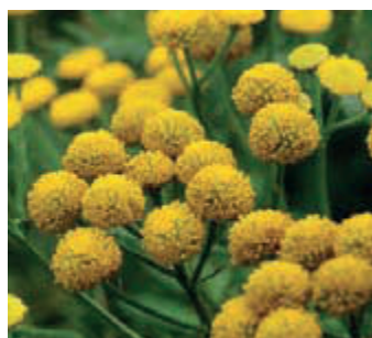
Boerenwormkruid ( Tanacetum vulgare )