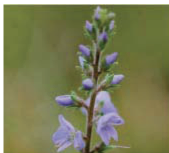
Mannetjesereprijs ( Veronica officinalis )