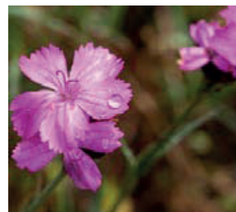
Kartuizer anjer ( Dianthus carthusianorum )