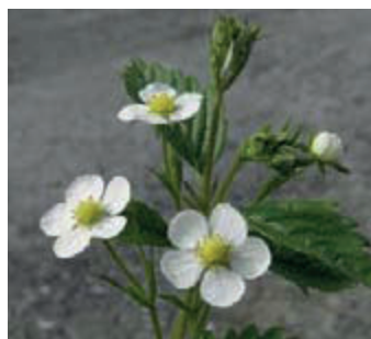
Bosaardbei ( Fragaria vesca )

Een waardplantenactie pakket bestaat uit negen stuks inheemse waardplanten, die je zelf kunt samenstellen uit deze achttien soorten.