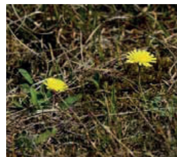
Muizenoor ( Pilosella officinarum - Hieracium pilosella )